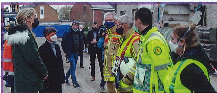
De gouverneur brengt een bezoek aan de rampsite na de gasexplosie in Turnhout op 1 januari jl. (©Jef Matthee).

"Corona of niet: mijn vrije tijd breng ik min of meer op dezelfde manier door. Net als mijn man en kinderen ben ik een boekenverslaafde veellezers. We zijn dol op theater, dans en opera en gaan dus ook geregeld naar voorstellingen. In Coronatijden was ik soms wel aangewezen op livestreams. Ik tracht elke dag wat te sporten en wanneer het kan, gaan we met het gezin of apart met één of beide kinderen wel eens op citytrip."